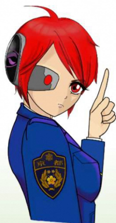
京都府警察サイバーセンター イメージキャラクター 才羽 京子(さいば きょうこ)

サイバー犯罪の被害報告は増加の一途を辿っています。その手口も巧妙化しており、持続可能な企業経営において情報セキュリティ対策は避けられない重要課題となっています。会社をサイバー攻撃から守る中心的担い手である実務担当者は、十分な予防対策だけでなく、被害にあった際の適切かつ速やかな具体的アクションについても正しい理解と準備が求められています。