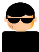
攻撃者 (A社のなりすまし)